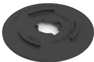
Deska P30 litinová

Deska podkladová VARIO se skládá ze dvou dílů, hlavního dílu VARIO A a vložky VARIO B. Montáž i demontáž těchto dílů se provádí bez použití nářadí. Pouze zamáčknutím rukou. Správná poloha dílů je, když jsou nápisy VARIO B a VARIO A pod sebou. Všechny teleskopické zemní soupravy vyjma šoupátkové JMA se prostrčí otvorem ve smontované univerzální podkladové desce VARIO a pootočí o 90°. Šoupátkové zemní soupravy JMA se zasunují do dílu VARIO A bez použití dílu VARIO B.